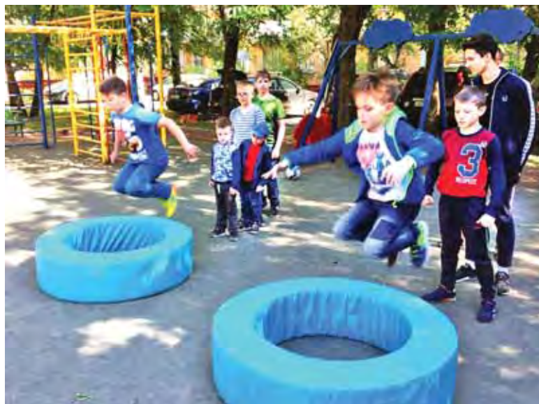
На празднике двора