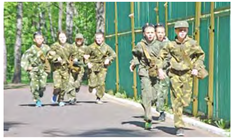
Спортивная игра «Победа»

Записаться можно как по адресу ул. Свободы, 55, тел.: 8-499-493-91-47, так и по адресу бульвар Яна Райниса, 3, тел.: 8-499-492-06-62