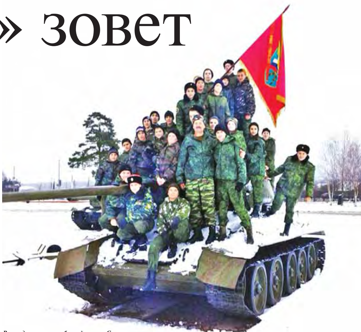
В походе по местам боевой славы. Снегири.

Первое направление - военно-патриотическое. Хорошо зарекомендовала себя военная подготовка, в программу которой входят: общая физическая, строевая, огневая, тактическая, военно-медицинская подготовки, рукопашный бой, туристические походы, школа выживания. В 2007 году, когда клуб был муниципальным учреждением, а в школах еще не практиковалось кадетское воспитание, сотрудники «Родины» организовали муниципальный кадетский корпус и, осуществляя эту работу, взаимодействовали со школами района. Позже в школах появилось кадетское воспитание, и уникальные авторские програм-