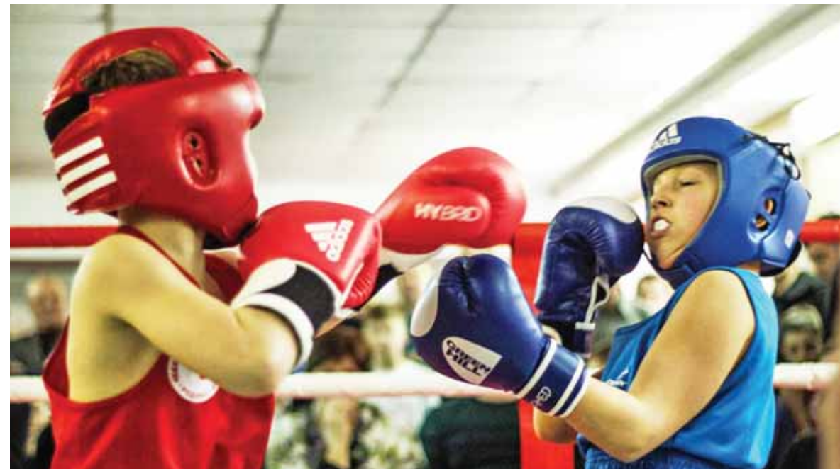
На соревнованиях по боксу

на бульваре Яна Райниса, 3. Помещение на бульваре Яна Райниса оформлено как боксерский клуб, и там замечательная секция бокса, которая подготовила много победителей и призеров всевозможных турниров. Кроме того, там проводят занятия секции карате, рукопашного боя, тайского бокса.