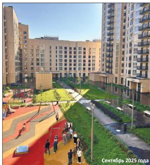
Сентябрь 2025 года